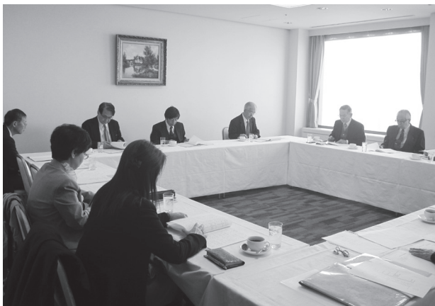
〈理事会の様相（11月21日、於 東海大学校友会館）〉

●ローエイシア第32回香港大会 2019年11月5日～8日、於 香港 lawasia@lawasia.asn.au