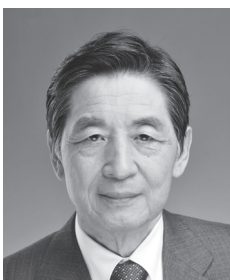
日本ローエイシア友好協会会長 元ローエイシア会長