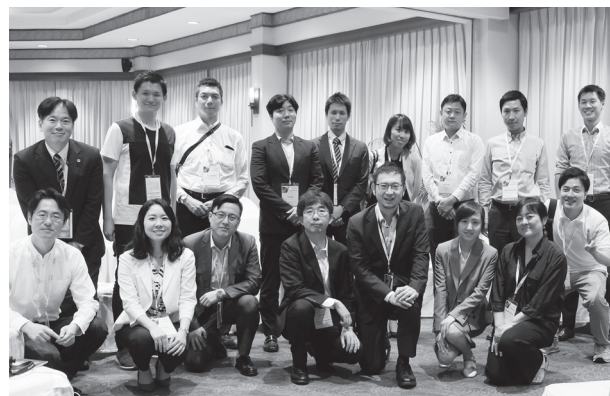
Young Lawyers Committee

LAWASIAの大会は、いわゆる「商売商売」した感じではなく、それぞれがセッションと交流を楽しんでいるところが良い。香港大会も実に楽しみである。