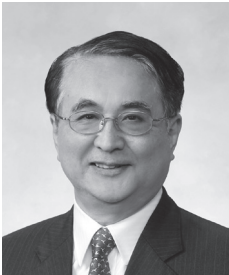
日本ローエイシア友好協会副会長 元ローエイシア会長