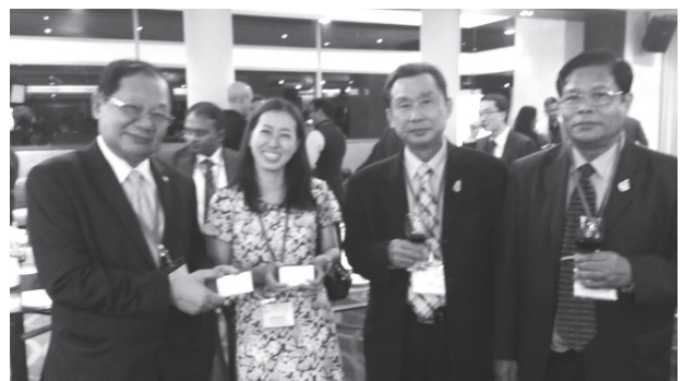
Welcome Reception にて

日本国内における国際化の流れが激しくなる中、今回LAWASIAに参加させていただいたことは何事にも代えがたい財産となった。今回の会議で知り合った方々とのお付き合いを大事にしながら、また知り合えた各国の若手法曹に負けないう、これからも研鑽を積んでいきたい。なお、2015年1月にインドへ行くのだが、LAWASIAで知り合ったインド人弁護士と会う約束をしている。今からとても楽しみである。