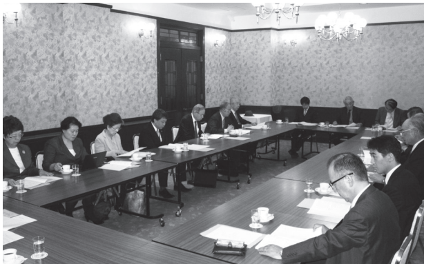
〈理事会の様相（11月18日、於 法曹会館）〉