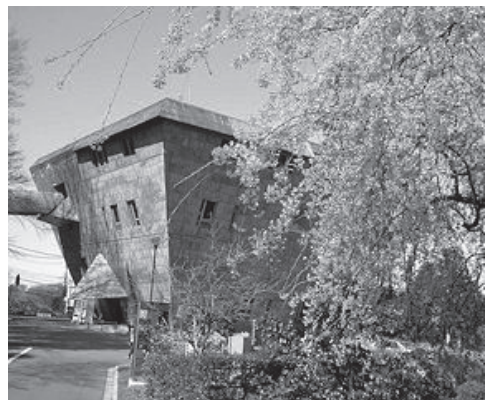
■会場の大学セミナー・ハウスは, 設備が整備され, しかも静かな落ちついた研修に最適の場所です。