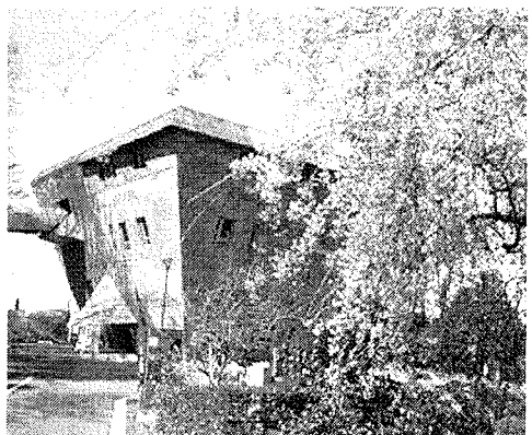
■会場の大学セミナー・ハウスは、設備が整備され、しかも静かな落ち着いた研修に最適な場所です。